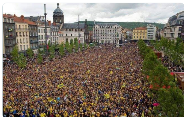
10:34 AM · 18 nov. 2018

ça fait plaisir de voir qu'il y a du monde pour les gilets jaune autant que pour la coupe du monde ! les français se réveillent ! Bravo !