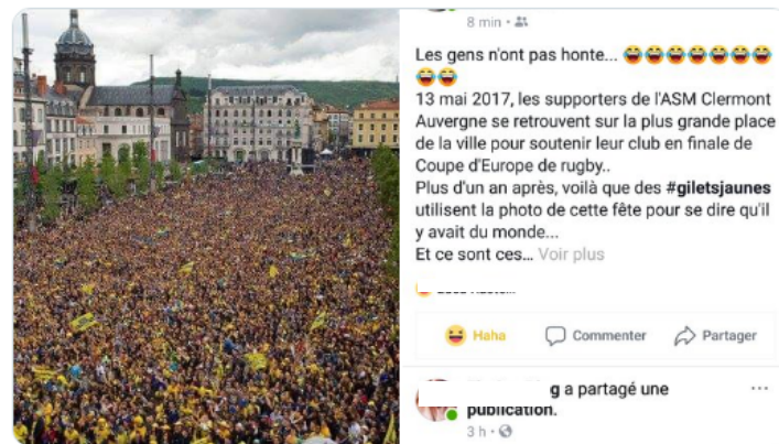
3:56 PM · 18 nov. 2018

Arrêtez de partager cette photo en pensant que ce sont les gilets jaunes à Clermont-Ferrand, C'était pour la finale de la coupe d'Europe 2017 (l'ASM Clermont joue en jaune).