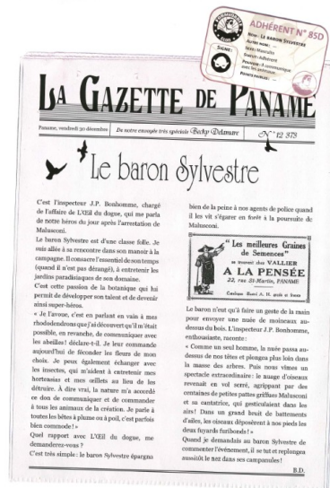
Exemple fiche élèves